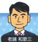
45歳。思いやりと決断力がある若手社長