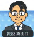
40歳。経理・総務のベテラン。袋小路君と良いコンビ