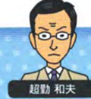
40歳。几帳面な工事課長。袋小路君の天敵