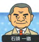
55歳。会社一筋37年。頑固一徹、根はやさしい工事部長